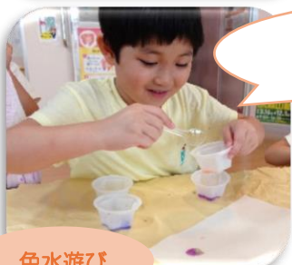
ピンクと水色を混ぜたら、紫色になったよ!