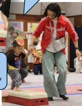
それいけ！ アンパンマン