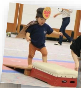
ママと一緒に 嬉しいな♡