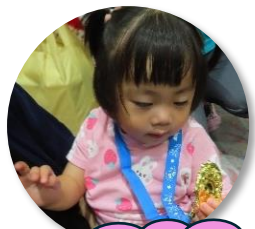
メダル ぴっかぴか