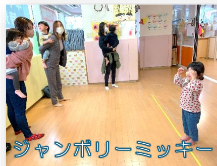
ジャンボリーミッキー

11月8日(金)お忙しい中、保育参観に来ていただき、ありがとうございました。今回の保育参観では、普段子どもたちが親しんでいる遊びや、歌、ダンスを保護者の方と一緒に楽しんでもらおうと思い、活動に取り入れました。いつもと違う雰囲気、照れたり、恥ずかしさを感じたりしている様子が見られましたが、堂々と歌やダンスを披露したり、お友達同士での関わりや“自分でやってみる”という姿も見られたりと、去年からまた一段と成長した姿が見られたのではないのでしょうか◎今年度も残り数か月。子どもたちと楽しみながら、一人一人の良さを伸ばし、成長を支えていきたいと思っていますので、気になることがあれば、いつでも気軽にお声がけください。