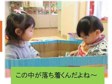
この中が落ち着くんだよね~