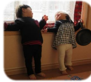
ばあっと一緒にストレッチ