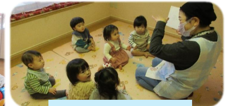
絵本も大好き♥わくわく・ドキドキ😊